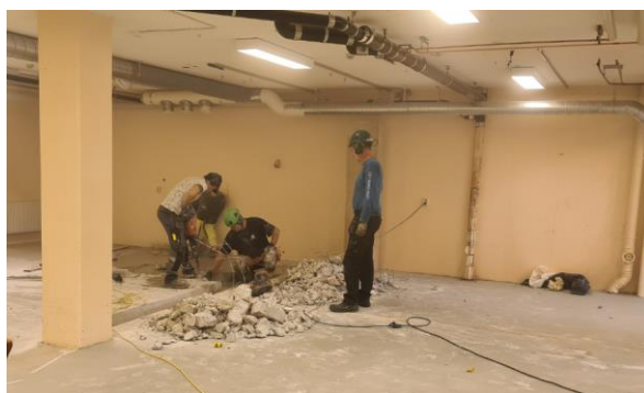
Arbete pågår för att anpassa de nya lokalerna till invigningen.

Vi kommer att hålla dig underrättad så att du som medlem kommer att kunna följa med när flyttlasset går. Vi tror att den nya lokalen har kapacitet att möta vårt behov för framtiden. Hoppas att det här har gett dig en inblick i vad som planeras framåt.